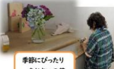
季節にぴったり あじさいの花

OGOさんの「お花ボランティア」のみなさんが、学校花壇や校内ワークスペースにお花を飾ってくださいます。子ども達は「お花がきれいだね」「お花を見ると、心が落ち着く」と話をしています。「僕もやってみたい」といって、手伝ってくれる子もいます。教職員も、心穏やかに、子どもと接することができます。OGOさんの『お花ボランティア』が発足して、1年が経ちました。関わってくださるみなさん、ありがとうございます。そして、お花が好きな方がいらしゃったら、気軽にご参加ください。【定期活動は、毎月第二水曜日 午前中】