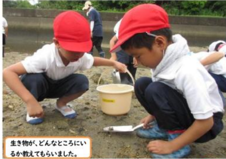
生き物が、どんなところにいるか教えてもらいました。