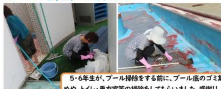
5・6年生が、プール掃除をする前に、プール底のゴミ集めや、トイレ・更衣室等の掃除をしてもらいました。感謝!!