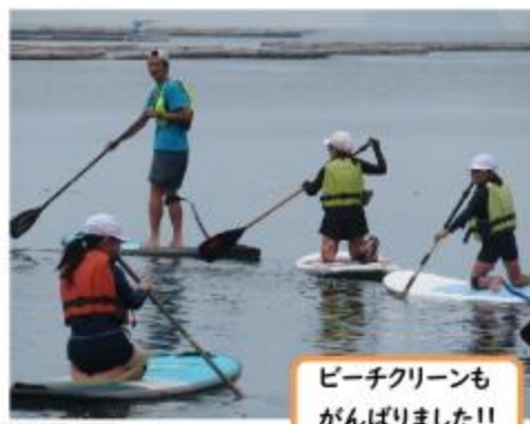
ビーチクリーンも がんばりました!!

江田島の子どもの特権である海の学習(さとうみ学習)が始まりました。1・2年生は、さとうみ科学館の西原館長と一緒に、深江地区の島戸川河口で、生き物採取を行いました。5年生は、長浜海岸でビーチクリーンをした後に、サップ・カヌー体験をしました。楽しんだ体験を図工の時間に、絵をかいて表現します。