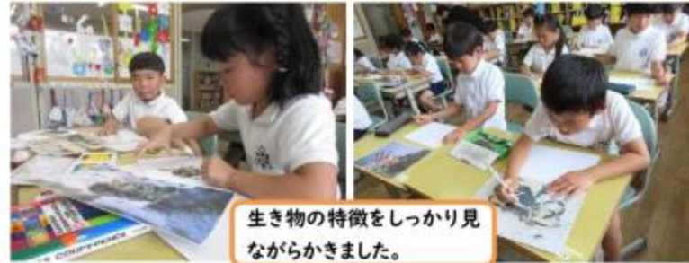
生き物の特徴をしっかりと見 ながらかきました。