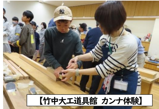
【竹中大工道具館 カンナ体験】