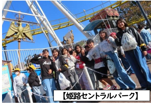
【姫路セントラルパーク】