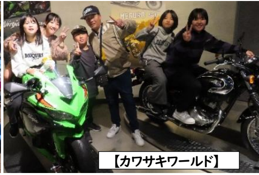
【カワサキワールド】