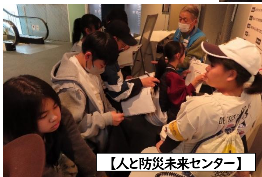
【人と防災未来センター】