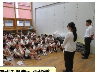
バスを利用する児童への指導

お話いただいたことは、2件とも学級指導を行いました。また、バスの乗り方については、登下校でバスを利用する児童を集めて指導をしました。地域の方に見守られながら成長できていることに感謝します。よいことも、そうでないことも、声をかけて頂ければと思います。今後ともよろしく願いいたします。