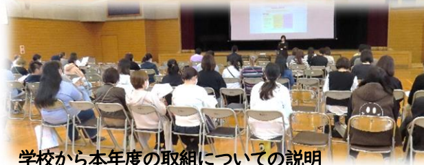
学校から本年度の取組についての説明