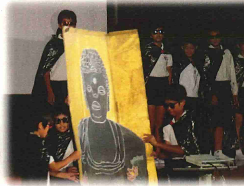
6年:江田島の魅力届け隊