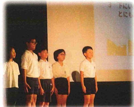
4年:ピッピの知らない防災の世界