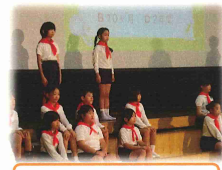
3年:江田島 ふしぎ発見