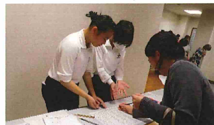
保護者・地域の皆様。たくさんの 声援をありがとうございました。