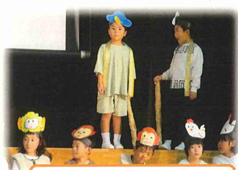
1年:十二支のはじまり