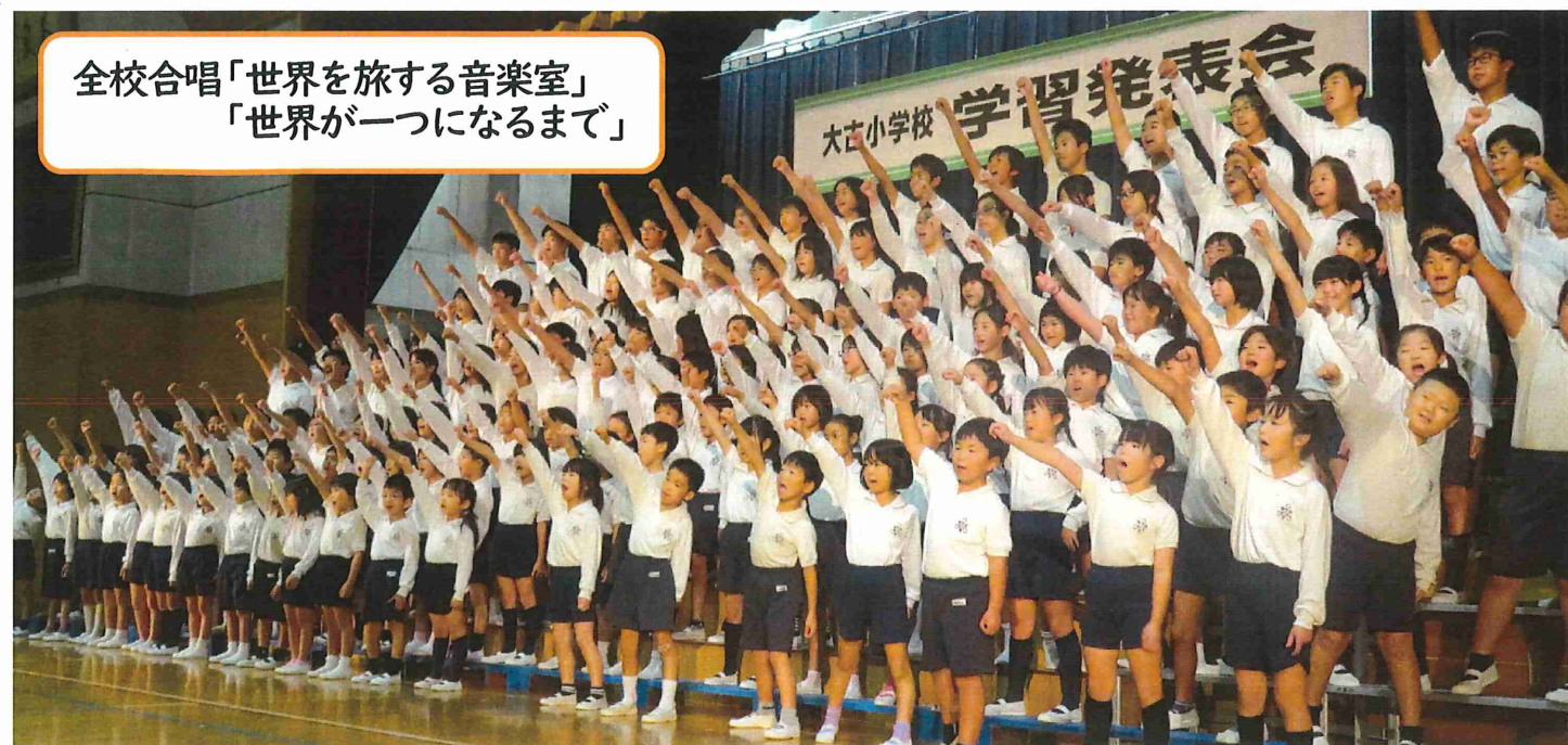
全校合唱「世界を旅する音楽室」 「世界が一つになるまで」