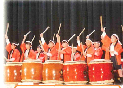
2年:大古たいこクラブ