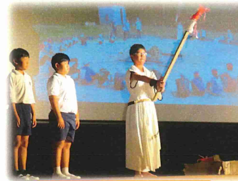
5年:レッツゴー江田島