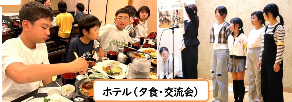
ホテル(夕食・交流会)