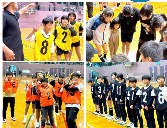
役員、保護者の皆様、運営や引率等ありがとうございました。

キャプテンを中心として、休憩時間を使っでの練習にも取り組みました。本番では、練習の成果を出し、いっぱいプレーすることができました。