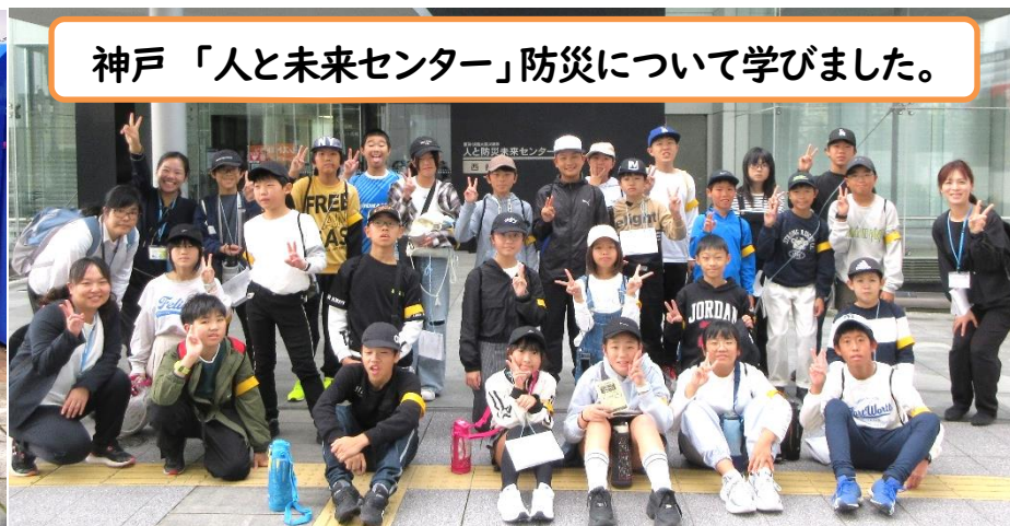
神戸「人と未来センター」防災について学びました。