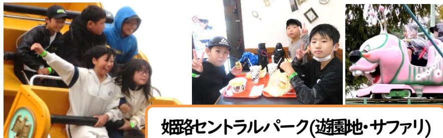
姫路セントラルパーク(遊園地・サファリ)