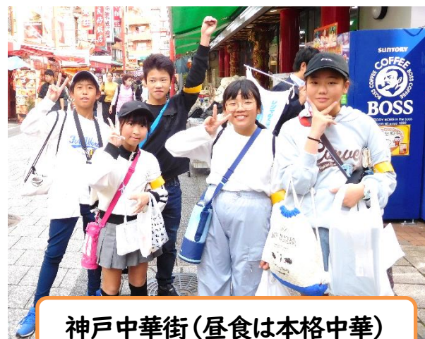
神戸中華街(昼食は本格中華)

10月31日(木)～11月1日(金) 泊2日 ～ 神戸中華街・人と未来センター・姫路城・姫路セントラルパーク～